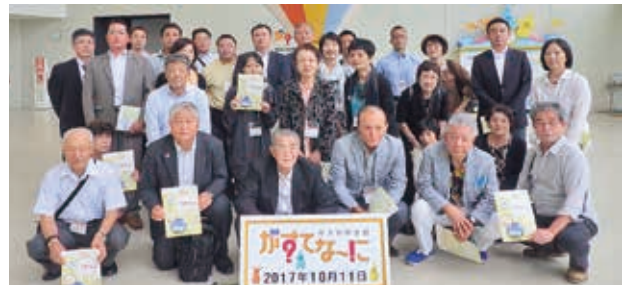
平成29年10月 がすてなーに