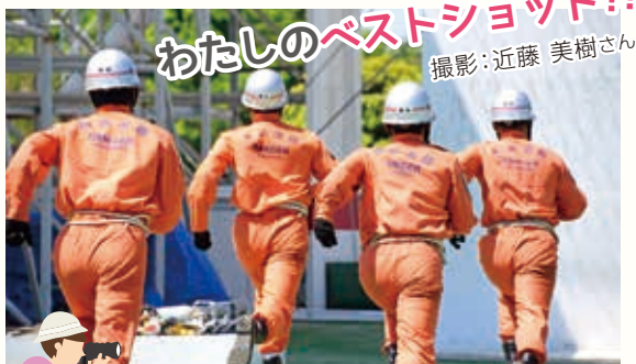
レンジャー隊員の一条乱れぬチームワーク 四人の動きからよくわかります。