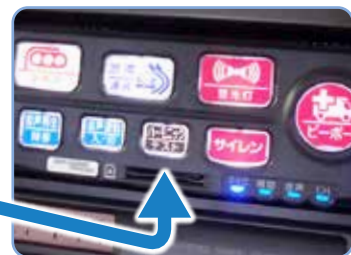
ハーモニックサイレン