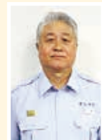
やつるぎ 八鈿消防署長 (焼酎だいすき)