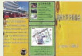
入会案内パンフレット