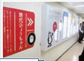
清水建設技術研究所