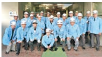
平成29年11月 JFEスチール東日本製鉄所 京浜地区