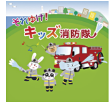
CDジャケットデザイン