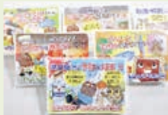
広報用ティッシュ