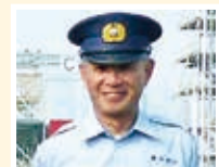
秋元港南消防署長 (豎坑斜坑大好き)

ーメン屋さんが大盛況となっていた気がします。多いときは15軒ほどだった店も現在は10軒前後と数は減った気がしますが新しい店も進出する、いまだラーメン屋さんの多い道路です。家系やがんこ系(あまり詳しくありませんが)など、みなさんもちょっとラーメンを食べたいとき、この道路を車で流してみてもいいでしょうか。