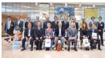
平成29年10月 東京ガス株式会社根岸LNG基地