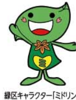
緑区キャラクター「ミドリ」