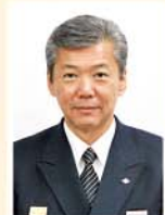
安江消防署長 (ガンバレ!マリノス)