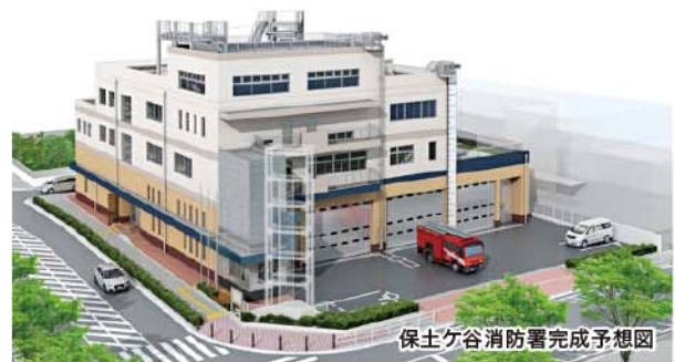
保土ヶ谷消防署完成予想図

庁舎機能を維持するため、敷地のかさ上げ、庁舎内の一部に止水板を設け、事務室、機械室を2階に配置