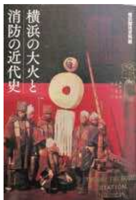
開港以来における横浜の 消防の歴史が満載の「図録」