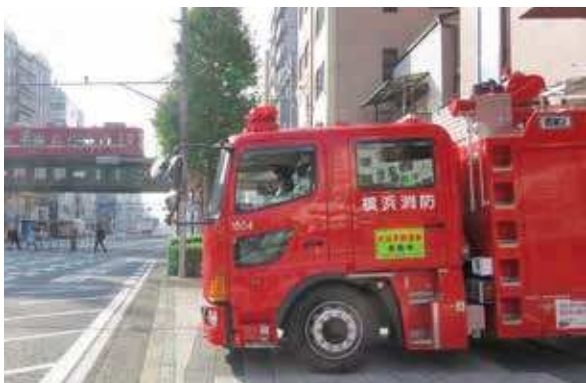
現在の地に創設以来、移転や統廃合なく100周年を迎えた 全国で唯一の消防署です