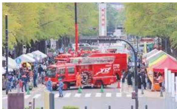
11月9日「119番の日」に、日本大通りにおいて、 記念イベント「中消防署100th Anniversary 大感謝祭」を開催