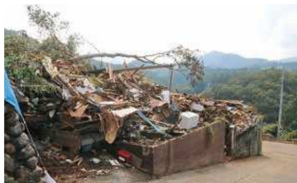
台風19号の記録的強風で二砂塵れが起き、牛舎が巻き込まれた現場 =平塚市平塚=

災害に向き合うとはどういうことなのか。思い知らされた今回の経験から何を学び、次に結んでいくか。断片を切り取り、つなぎ合わせながら、地域が前を向けるような情報を発信していくしかない。