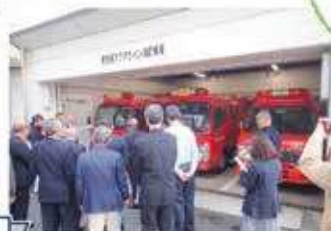
東京湾横断道路防災施設