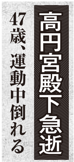
当時の新聞(イメージ)

後編では、2007年7月のAED市民利用開始から2年半後に起こったある出来事をお話したいと思います。