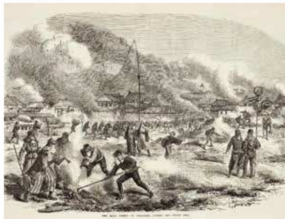
慶応の大火 『イラストレイテッド・ロンドン・ニュース』 1867年2月9日 横浜開港資料館蔵

安政6（1859）年の開港以降、火災を克服するため、横浜に暮らす人びとは試行錯誤を重ねながら防火体制を整えていきます。そして災害とむきあう「消防」は都市横浜に不可欠な存在となっていきました。本展示では、横浜市中消防署の誕生100周年を記念し、開港直後の町火消から戦後の自治体消防に至る横浜消防のあゆみをたどっていきます。