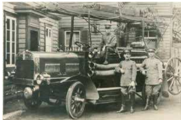
中消防署の前身の薩摩町消防組に配置された 日本初のガソリンポンプ消防自動車「メリーウェザー号」