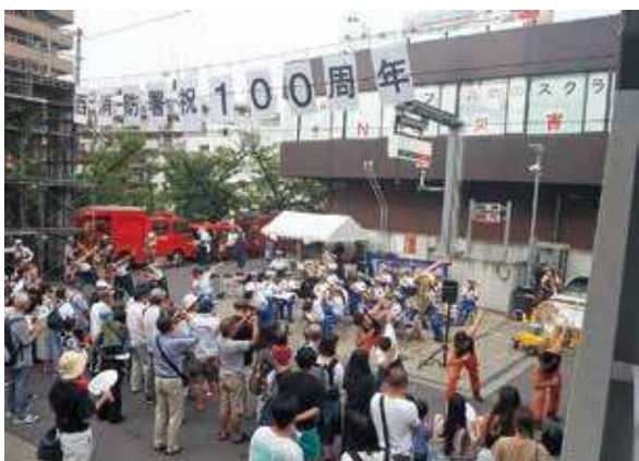
9月1日(記念日)、創設100周年記念行事 「消防防災ふれあいフェスタ2019」を開催