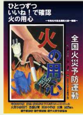
火災予防運動ポスター