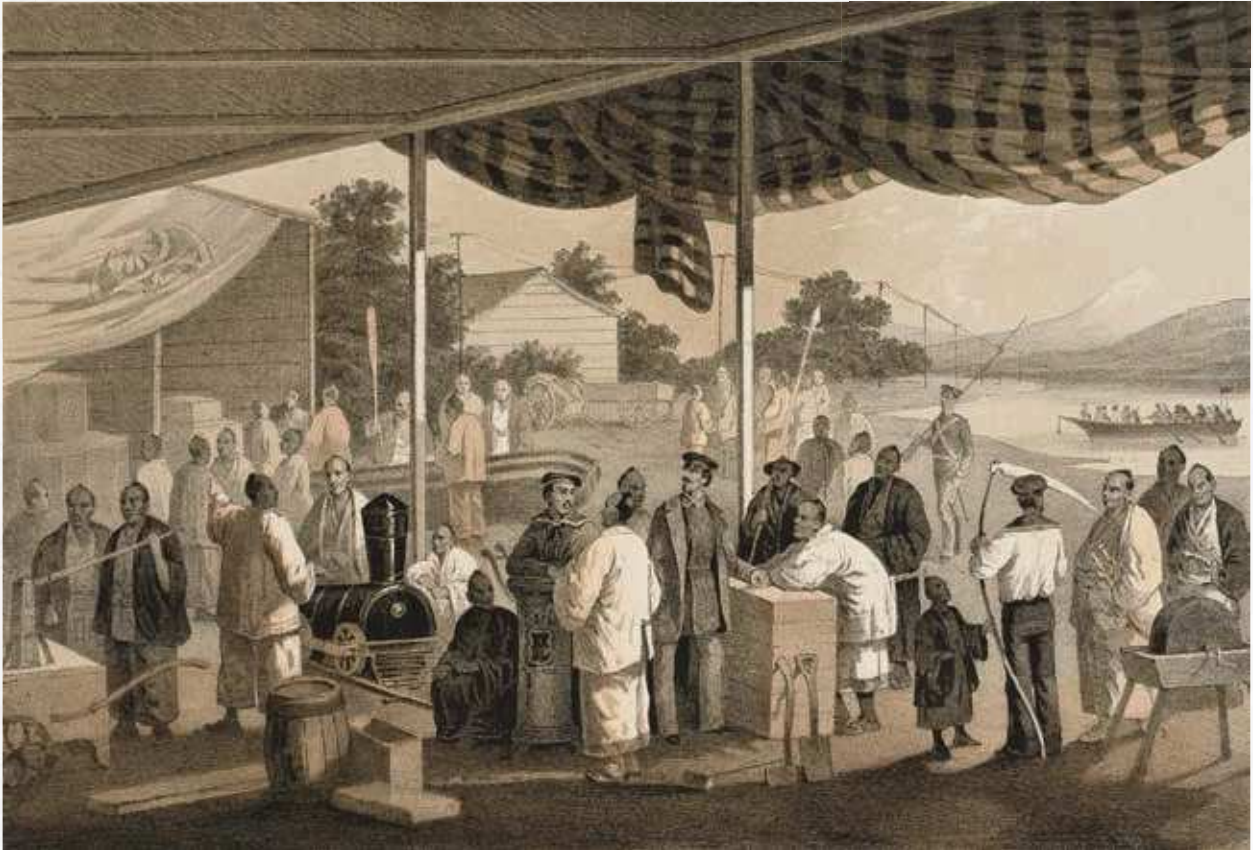
横浜にてアメリカからの贈り物の引き渡し ハイネ画 『ペリー艦隊日本遠征記』

1854年3月31日（嘉永7年3月3日）、日本側全権の林復斎（大学頭）とアメリカ側全権のマシュー・ペリーとの間で日米和親条約が締結され、日本はアメリカと国交を結んだ。それに先立つ3月13日（2月15日）、アメリカ大統領から幕府への寄贈品が陸揚げされ、日本側に披露された。ここで蒸気機関車の模型が組み立てられ、21日に実演されたのは有名な話である。その一方で、この時、西洋式の腕用ポンプが実演された話はあまり知られていないだろう。