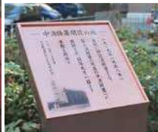
「中消防署開設の地」 記念碑を作成