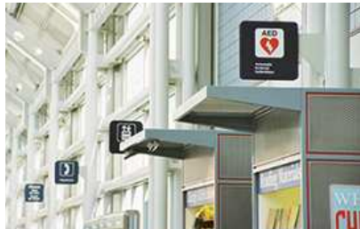
2000年 シカゴ・オヘア空港にて