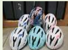
子ども用訓練ヘルメット