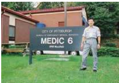
2000年 ピッツバーグ市消防局で研修を受ける筆者

AEDは1980年代に国外で実用化され救命効果は医学的に立証されていました。そこで、米国のクリントン大統領が2000年にAEDの公共施設への設置と米国航空機への搭載を義務付ける声明を発表します。私はちょうど2000年と2002年に先進的救命技術を学ぶために米国へ救急車同乗自己研修に行ったのですが、空港内に徒歩1分圏内ごとにAEDが設置されているのを見て実に驚いたものでした。