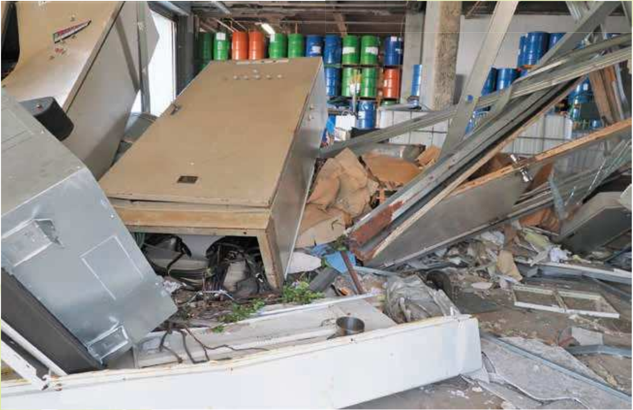
台風15号で被災した横浜市金沢区の事業所。高波の猛威を物語っている