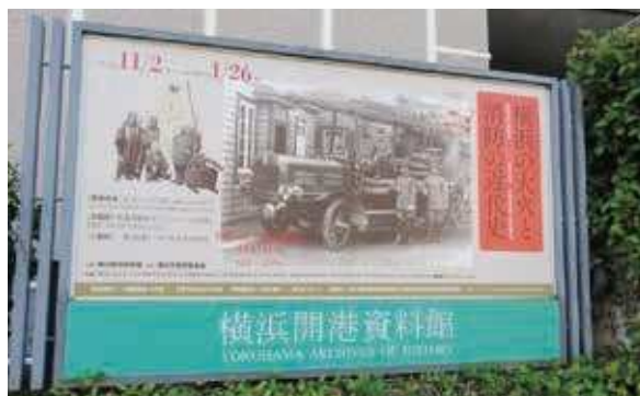
横浜開港資料館との協働により、消防署開設100周年を記念した 企画展示を令和2年1月26日まで開催中