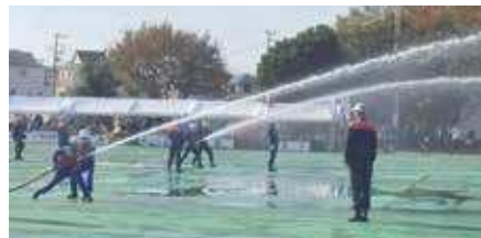
訓練の様様(小型ポンプ操法)

訓練会では、屋内消火栓操法I(女性の部)・屋内消火栓操法II(男性又は男性女性混成の部)・小型ポンプ操法の3種目が実施され、各区から選抜された自衛消防隊が、事業所はもとより地域の安全・安心を守るため、日頃の訓練成果を披露しました。